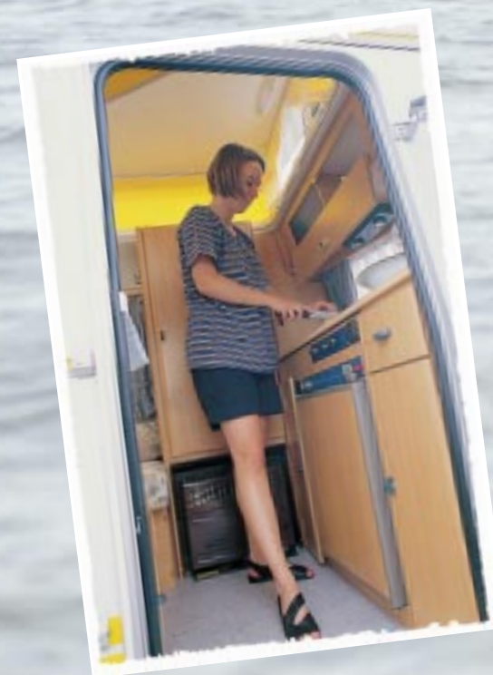
Die Küche im Bug kann mit der in einem großen Caravan mithalten. Leider müssen Kühlschrank und Heizung extra geordert werden.