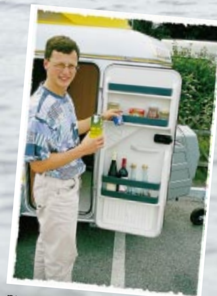
Die Eingangstür hat praktische Ablagen und wurde von uns Zweitkühlschrank getauft.