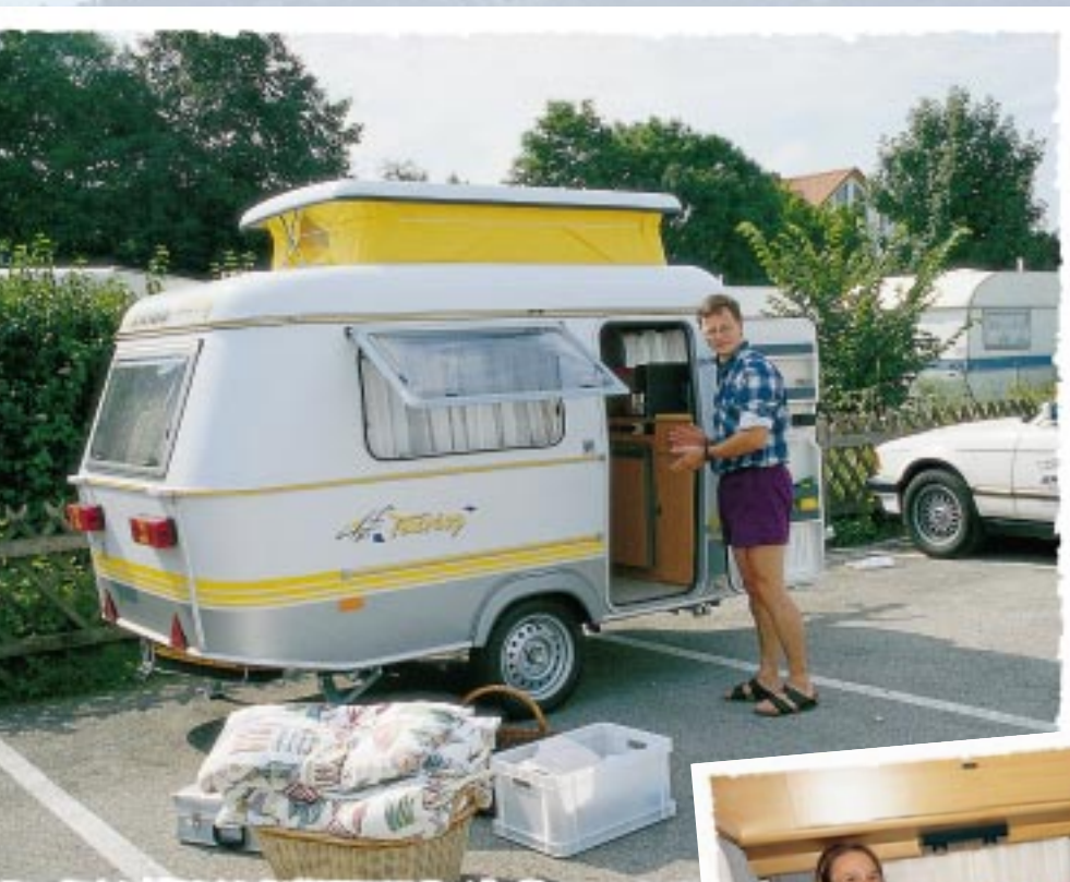
Der kleine Caravan bietet erstaunlich viel Stauraum. Am Tisch der Sitzgruppe haben wir es uns immer so richtig gemütlich gemacht.

Auch wenn die Außenmaße des Pucks gerade einmal 1,65 x 2,98 Meter betragen, verfügt der Caravan über ausreichend Stauraum, so daß wir unser Gepäck mühelos unterbrachten. Es machte richtig Spaß, den Wohnwagen einzuräumen. Größere Caravans verfügen in der Regel über mehr Schlafmöglichkeiten und ein Bad, aber nicht über proportional mehr Stauraum. Ge-