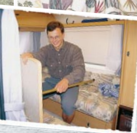
Aus der Sitzgruppe wird mit einfachsten Umbaumaßnahmen ein riesiges und bequemes Bett.