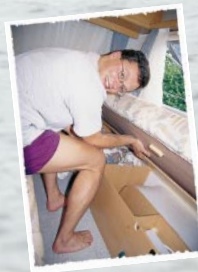
Der Sitzstaukasten ist schwer zu erreichen, aber für sperrige Gegenstände unerlässlich.